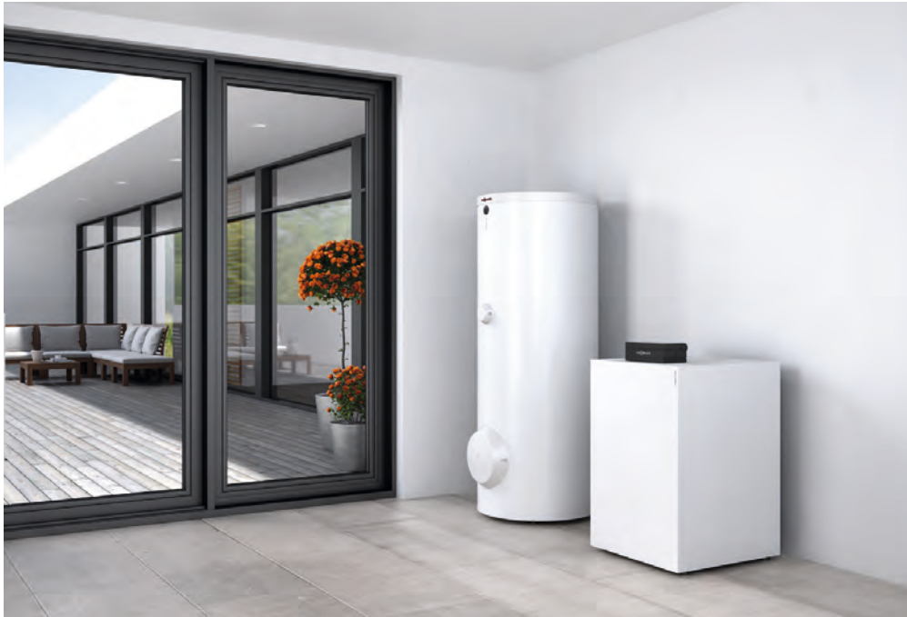
Lämpöpumppu Vitocal 300-G ja käyttövesivaraaja Vitocell 100-W

Vitocal 300-G maalämpöpumppu on modernin invertteriteknologian ansiosta tehokkain ratkaisu uudisrakennuksiin ja paras valinta laitteiston vaihtoa varten.